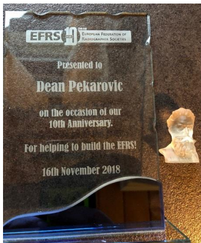
Slika 1. Plaketa