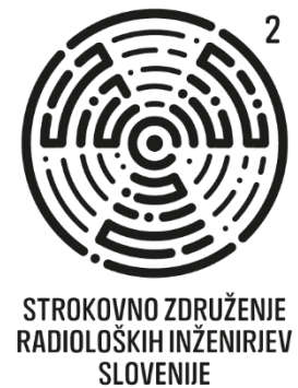
Slika 3: Pečati združenja