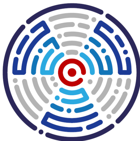
Slika 1: Logotip združenja v slovenskem jeziku

STROKOVNO ZDRUŽENJE RADIOLOŠKIH INŽENIRJEV SLOVENIJE